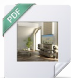
Wariant Klucz Comfort