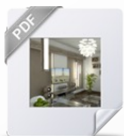
Wariant Klucz Silver