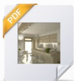
Wariant Klucz Gold