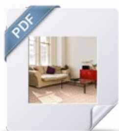
Wariant Klucz Klucz