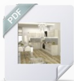
Wariant Klucz Platinum